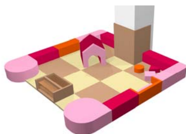
キッズスペース(2階)