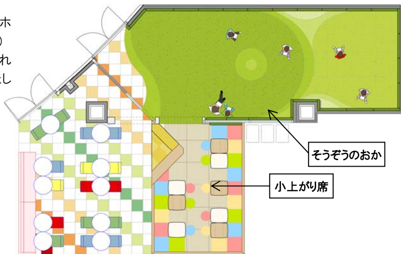
1階フードコート内 キッズゾーン