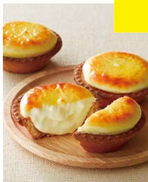
「BAKE CHEESE TART」 (洋菓子)