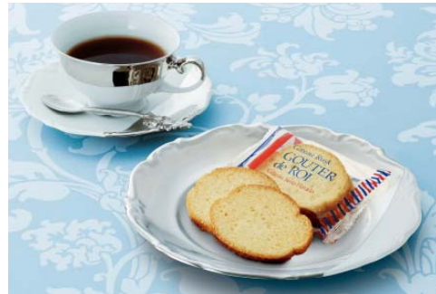
「ガトーフェスタ ハラダ」 (洋菓子)

MAISON FONDÉE EN 1878 GATEAU FESTA HARADA PATISSERIE CREATIONS GATEAU FESTA HARADA