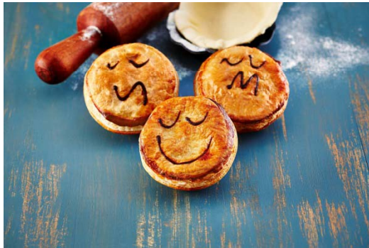
「pie face(パイフェイス)」 (パイ専門店)