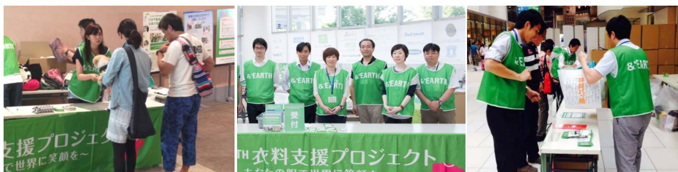
2015年5月(第13回)実施時の様子