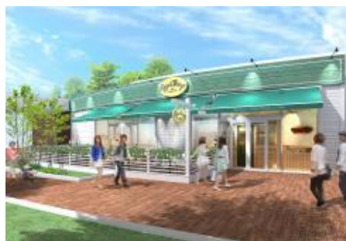
Eggs 'n Things