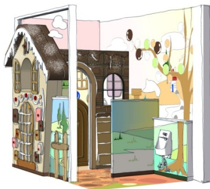
「キッズトイレ」イメージ