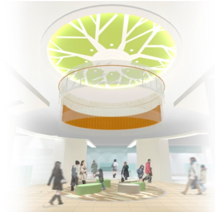
「ひかりの広場」イメージ

また、女性用トイレにベビーシートやおむつ用ごみ箱を増設、3階のキッズトイレは楽しいおとぎの国のイメージにデザインを変更します。ベビールーム(授乳室・オムツ替えスペース)は使いやすい空間レイアウトになり、オムツを替えている間お子さまが退屈しないよう、動物が遊ぶ図柄の壁紙などにリニューアルします。