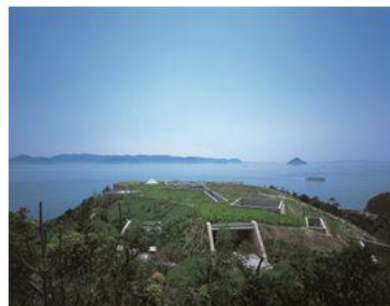
地中美術館