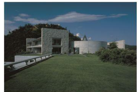
ベネッセハウス

当社は本企画をはじめとして、「その先の、オフィスへ」をスローガンに、既存のオフィス事業の概念を超えた、新しい付加価値の提供を行っております。