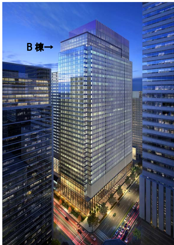
日比谷通り側よりB棟を望む

※B棟の主に高層階部分(3階、34~39階)に「フォーシーズンズホテル」が出店いたします。