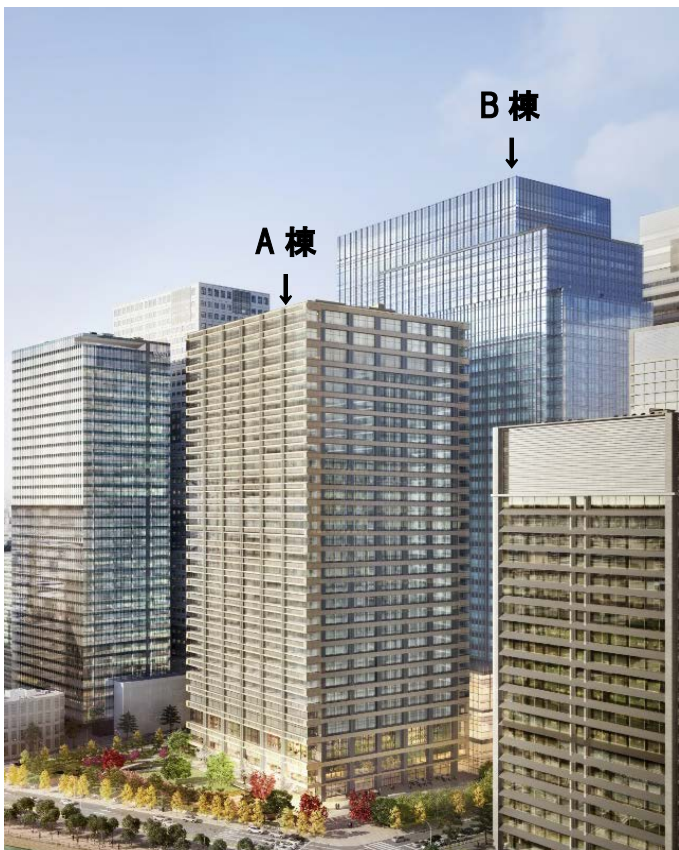
皇居側より計画地を望む