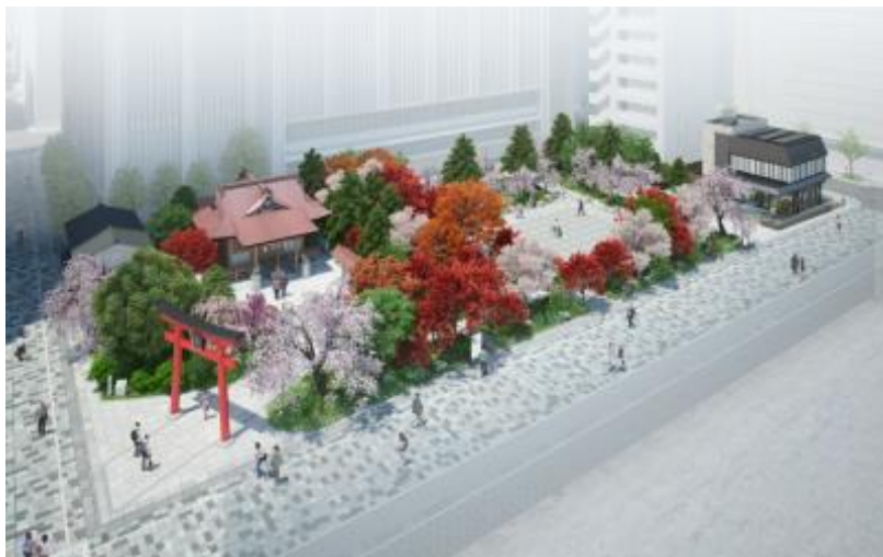
「福德神社」と「福德の森」全体イメージ

今、日本橋では、商業施設「コレド日本橋」「コレド室町」のオープンや当社も参画する「ライフサイエンス・イノベーション」の取り組みなどによって、これまで以上に多様な人々が集い、新たな賑わいが生まれています。その中心で、ハードとソフトの融合によって新たな地域コミュニティを創出する「福德の森」は、「日本橋再生計画」の象徴となる取り組みです。