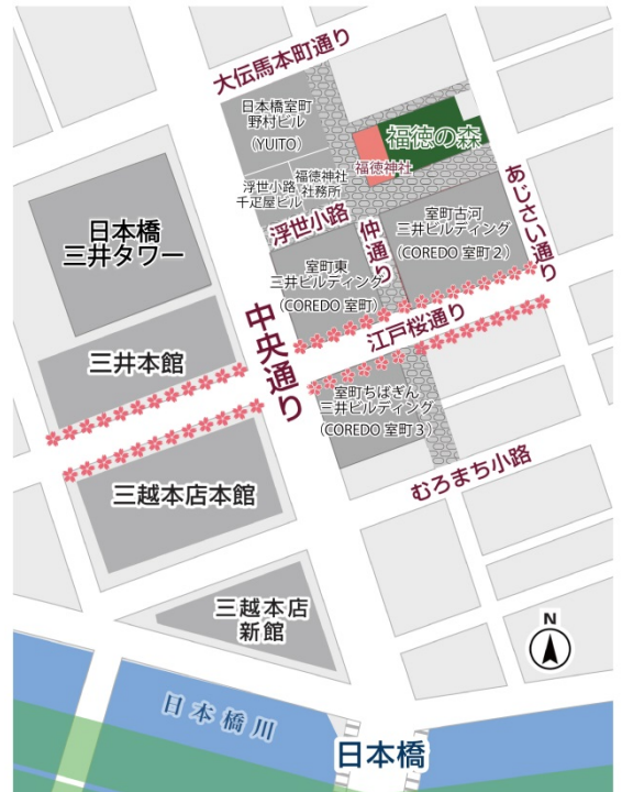
右:「福德の森」位置図