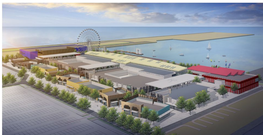
完成予想鳥瞰パース

今年1月に開業し好調に推移している「三井アウトレットパーク 台湾林口」での経験を生かして日系店舗を積極的に誘致するなど、当社グループの100を超える国内外の商業施設での開発・リーシング・運営により培ったノウハウを最大限に活かしてまいります。