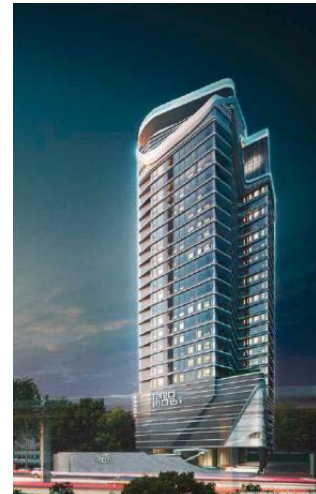
Ideo Mobi Sukhumvit 66