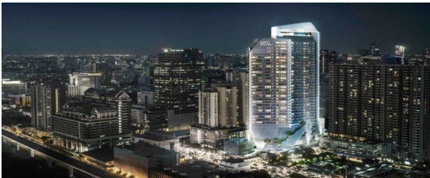
Ideo Mobi Asoke

■ また、「アナンダ社」との共同事業の第1号物件である「アイデオQ チュラサムヤーン」が2016年10月に竣工をむかえます。同物件はオフィス街の中心であるシーロム・サトーンエリアに隣接し、その立地の優位性、先進的な外観デザイン、充実した共用部計画などによりマーケットから評価いただき、全1,600戸につきほぼ完売いたしました。