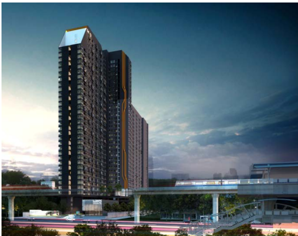
Ideo Sukhumvit 93