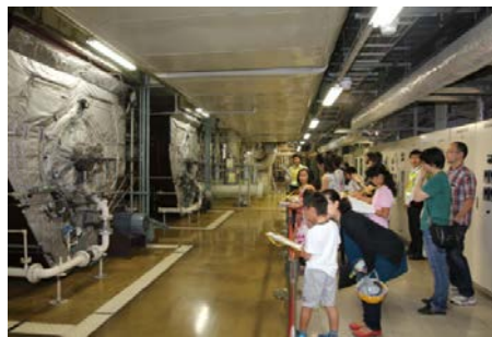
「霞が関ビル」自由研究ツアー