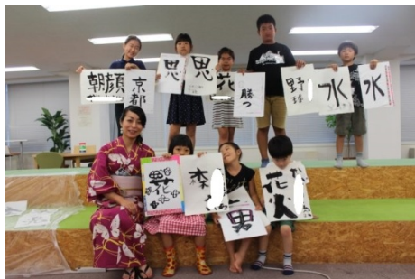
日本橋サマースクール

従業員のワークライフバランスを促進するとともに、当社が所有・運営する『三井のオフィス』に入居する企業に対し新たな付加価値を提供する取り組みとして、お子様を持ちながら働く方に向けて、春休み・夏休みの期間中の体験型学童サービスや自由研究ツアーなどを実施しています。また、『三井のオフィス』で働く方なら、どなたでも使えるフリースペース「harappa」を設置し、就業前後には、朝ヨガ、フラワーレッスン、英語レッスンといった暮らしを彩る様々なイベント企画しています。