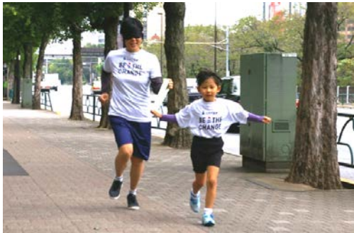
アイマスクランイメージ

スポーツには暮らす人々や働く人々、憩う人々の心身を健康にするだけでなく、新しいつながりを生みだし、コミュニティを活性化する力があります。当社は、スポーツを魅力的な街をつくる上で重要な要素と捉え、「スポーツの力」を活用した街づくりを推進していきます。また本イベントはパラリンピック競技の楽しさや興奮を感じ、その理解を深めることの一助となります。当社はこれらの活動を通して、パラリンピックの機運醸成を図り、東京2020大会の成功に貢献してまいります。