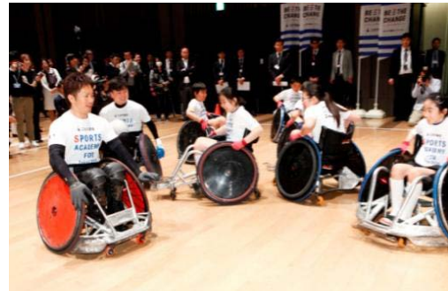
2016/4/13 日本代表選手によるウィルチェアーラグビーアカデミーの様子