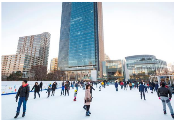
昨年のアイスリンクの様子

スポーツには暮らす人々や働く人々、憩う人々の心身を健康にするだけでなく、新しいつながりを生みだし、コミュニティを活性化する力があります。当社は、スポーツを魅力的な街をつくる上で重要な要素と捉え、「スポーツの力」を活用した街づくりを推進していきます。また、当社は今後も日本橋や湾岸エリア、当社が全国で運営するらぽーとや三井アウトレットパークなどの場の活用を通してアスリートを応援し、街とオリンピック・パラリンピックムーブメント双方の盛り上げを図るなど、東京2020ゴールド街づくりパートナーとして大会の成功に貢献してまいります。