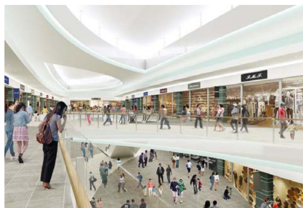
第2期イメージパース