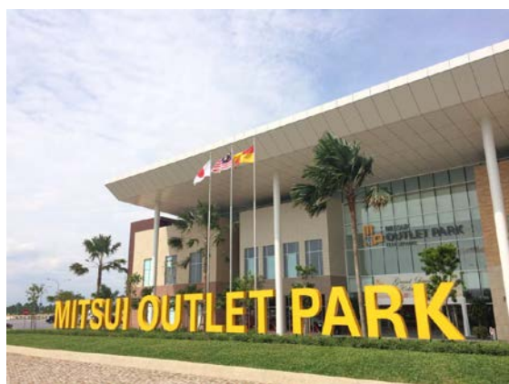
三井アウトレットパーク クアラルンプール国際空港 セパン外観