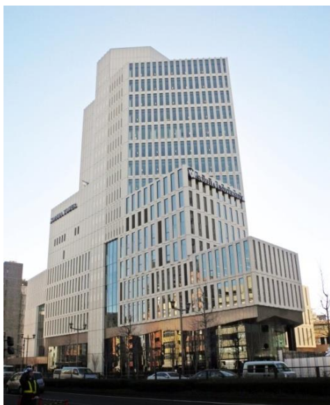
麴町大通り(新宿通り)からの建物外観

当社は、「不動産」に留まらない総合的なソリューションパートナーを目指す取り組みの一環として、今後とも、学校法人に寄り添い、学校・地域の歴史を重んじながら、各校のブランドをより魅力的にしていくためのキャンパス・施設整備のお手伝いや、保有資産の有効活用・収益の最大化など、グループ全体で取り組んでまいります。