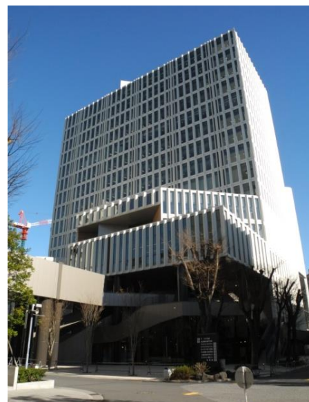
キャンパス内(西側)からの建物外観