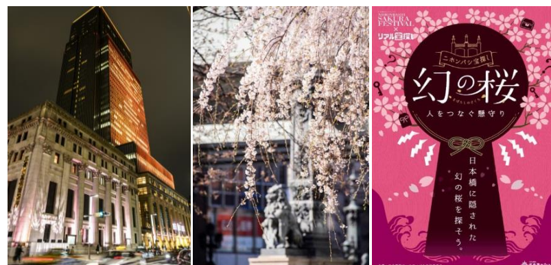
＜街中の桜を楽しめる宝探しイベントも実施＞