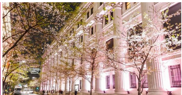
＜期間中、街全体が桜色に染まる＞