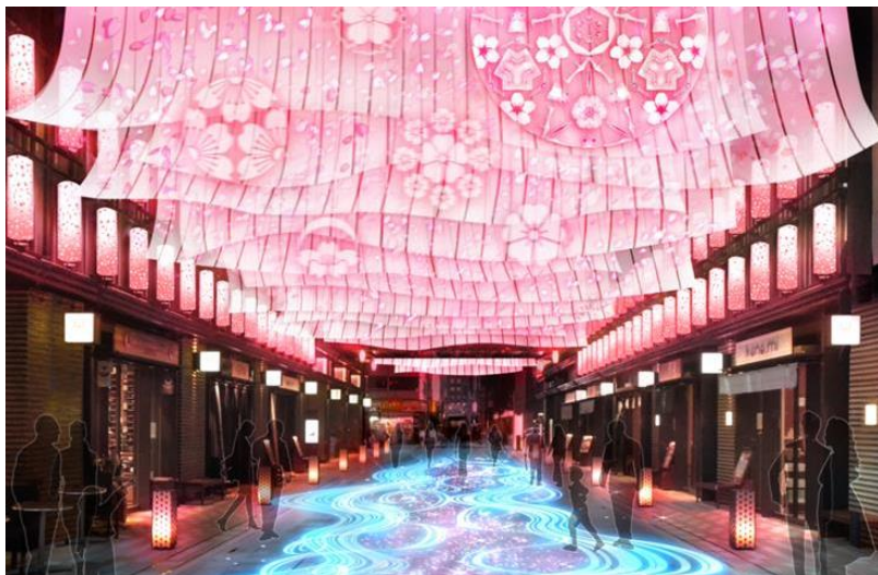
＜NIHONBASHI SAKURA GATE が初登場＞

福德神社周辺には3月25日(土)と3月26日(日)の2日間限定で「ニホンバシ桜屋台」が出現。日本橋の伝統ある老舗等が出店し、2日間限定のオリジナルメニューを気軽に楽しむことができます。