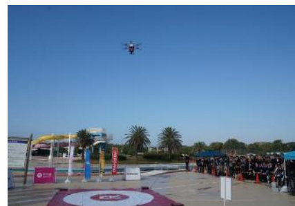
千葉市ドローン宅配分科会風景

国家戦略特区に指定されている千葉市は、幕張新都心を中核とする近未来技術を活用した街づくりを目指しており、現在様々な先端技術の実践活用が検討されています。具体的には、本プロジェクトエリア内における生活必需品や医薬品の「ドローン宅配」の検討や、幕張新都心内の公道（車道・歩道）を利用した「自動運転モビリティ」運行サービスなどの実現に向け、様々な分野の英知を結集した官民共同での実証実験を開始しています。