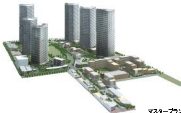
マスタープランに基づく街並みイメージパース ※5