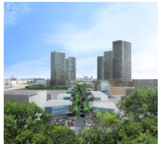
マスタープランに基づく街並みイメージパース ※7

『幕張ベイタウン ※6 』の街づくり開始から約20年、『(仮称)幕張ベイ Towers プロジェクト』では「街の賑わい」というソフト面をさらに充実させるため、2つの主要エリアを計画しています。具体的には、①海浜幕張駅や周辺地区から人々を招き入れる「商業エリア」、②この街の人々が子育て、自己研鑽等できるローカルサービスを充実させ、街の中心となる公園を通じて人々が様々なアクティビティを楽しむ「コミュニティエリア」。この2つのエリアで職・住・学・遊の各要素が街全体として機能し、多世代交流を可能にする“人が集まる都市”をデザインします。このように、「街の賑わい」つまり活気をもたらすことは、エリアマネジメントにおける価値形成に欠かすことができない要素と位置付けています。