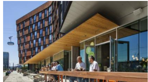
ZGF アーキテツ実績 The Emery: ポートランドのミクストユース・プロジェクト ©Eckert & Eckert