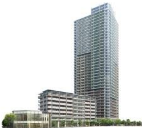
完成予想外観パース※1

<本物件ホームページURL> http://www.makuhari-pj.com/shinchiku/G1502001