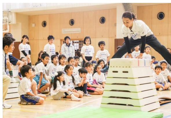
(参考) 第4回/体操アカデミーの様子