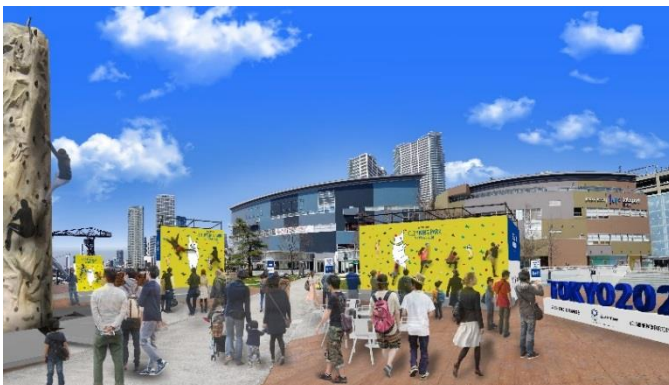
「三井不動産クライミングパーク for TOKYO 2020」イメージ（パース画像）

当社はこの活動を通して、街とオリンピックムーブメント双方の盛り上げを図るなど、東京2020ゴールド街づくりパートナーとして大会の成功に貢献してまいります。