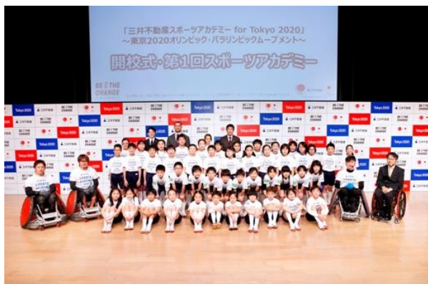
(参考) 開校式の様子