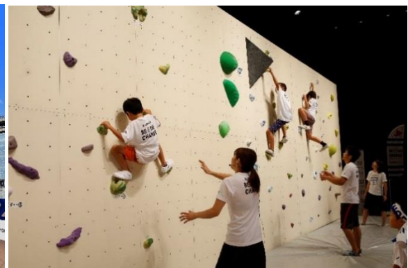
（参考）第3回/クライミングアカデミーの様子