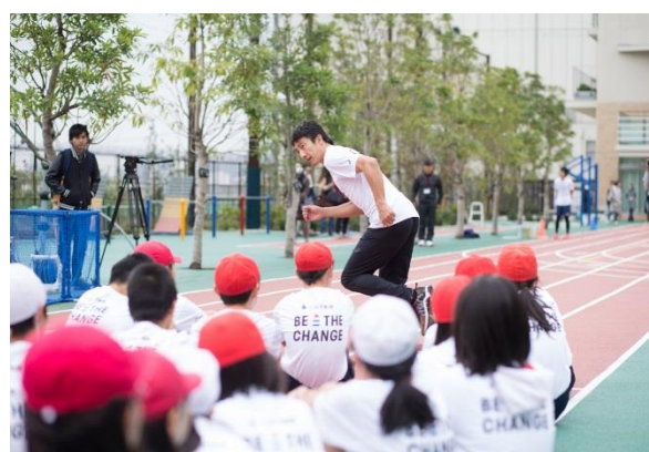
(参考) 第5回/陸上アカデミーの様子