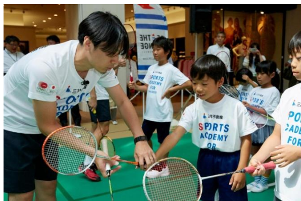
(参考) 第2回/バドミントンアカデミーの様子