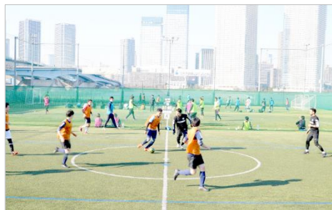
MIFA Football Park イベント

「MIFA Football Park 仙台(仮称)」は、40m×60mのジュニアサイズのサッカーコート1面または、フットサルコート3面としても利用可能なコートを完備。サッカースクールやレンタルコートの運営を予定しています。本施設には屋根も設置し、悪天候時でもプレーが可能になります。また、MIFAは子どもたちを対象とした音楽ライブとフットボールを楽しむイベントを開催するなど、音楽とフットボールを通じたコミュニケーションの場を提供します。