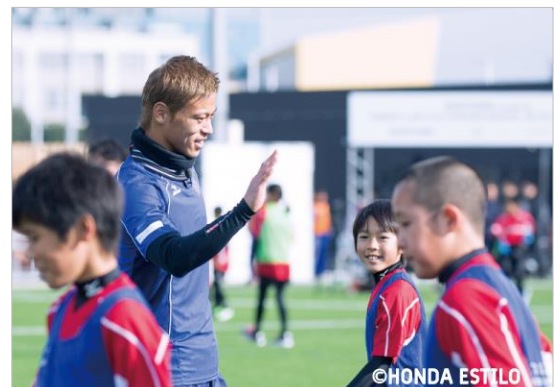
「SOLTILO FAMILIA SOCCER SCHOOL」