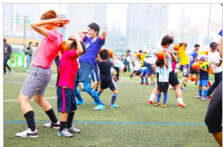
MIFA Football Park イベント