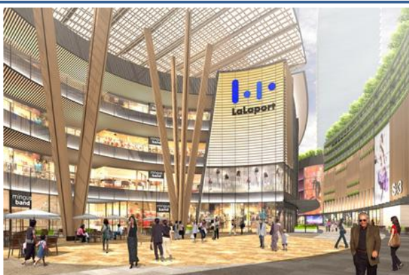
<屋外ストリートイメージ>