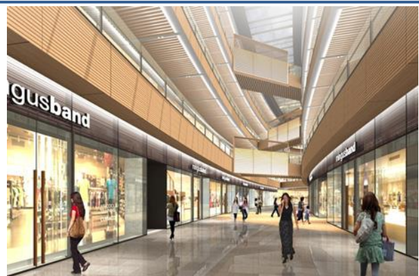
<モール内部イメージ>