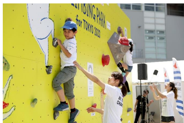
（参考）第7回/クライミングアカデミーの様子