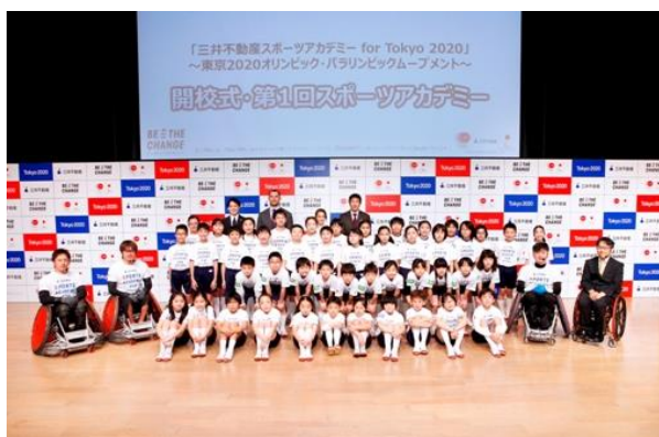
（参考）開校式の様子