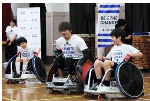
（参考）第8回/ウィルチェアーラグビーアカデミー