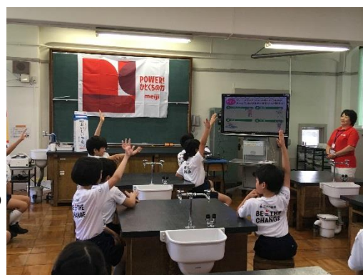
（参考）食育セミナーの様子

スポーツと同様に心身の健康を保つために「食」の大切さについても知っていただきたいという思いから、同じく東京2020オリンピック・パラリンピックのゴールドパートナー（乳製品・菓子）である、株式会社 明治様にご協力いただき、「食育セミナー」を併せて実施します。株式会社 明治様とのコラボレーションイベントは今回2回目となります。今年7月に開催したウィルチェアーラグビーアカデミー開催時のコラボレーションイベントでは、都内小学校の授業の一環として食育セミナーを開催しました。