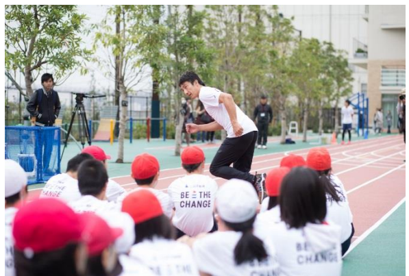
（参考）第5回/陸上アカデミー