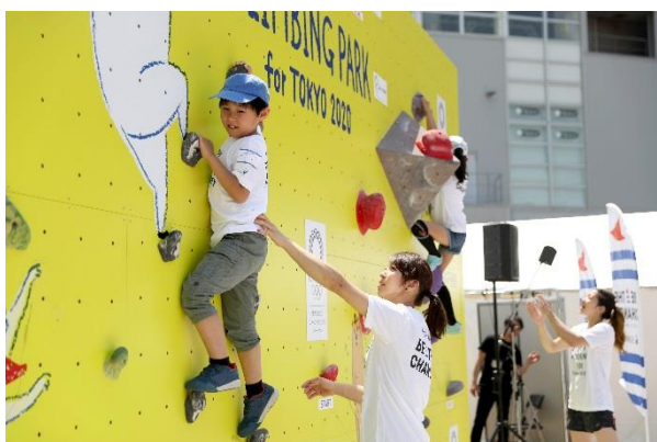
（参考）第7回/クライミングアカデミー