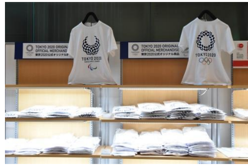
昨年度の様子(東京2020公式ライセンス商品販売コーナー)