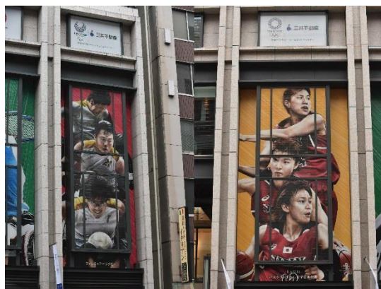
昨年度の様子（COREDO 室町 1・3 中央通り沿い壁面装飾）