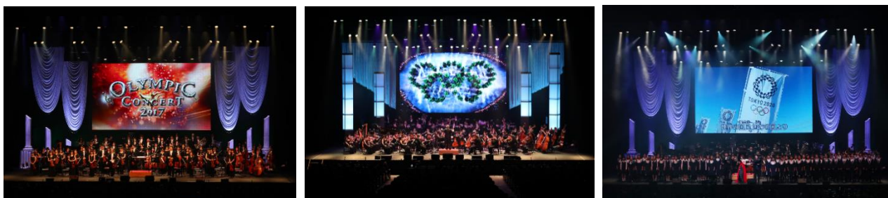
写真:オリンピックコンサート2016/2017より