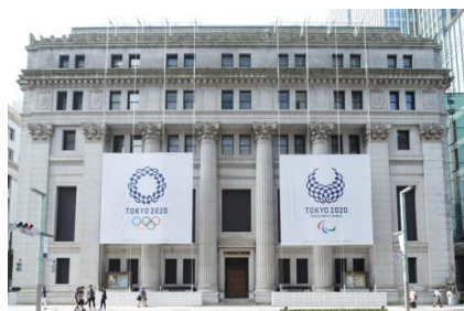
三井本館中央通り沿い壁面装飾

なお、本イベント期間中には、東京2020組織委員会が、日本橋三井タワー1階で期間限定の「東京2020公式ライセンス商品販売コーナー」をオープンします。