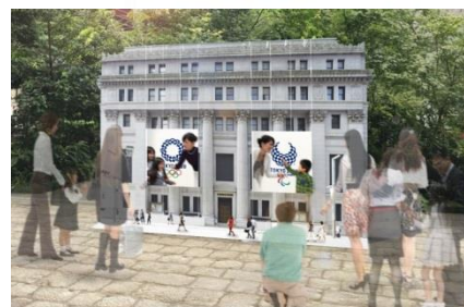
「日本橋シティドレッシング フォトセット」