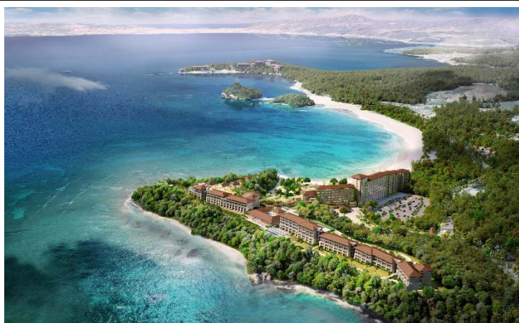
完成予想図(鳥瞰パース)