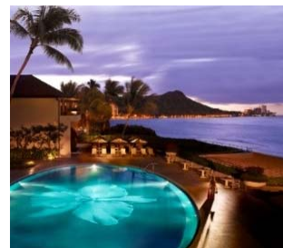
オーキッドを配したプール (ハレクラニ<ハワイ>)

また、海を臨み、ハレクラニの象徴であるオーキッドを配したプール、温泉を利用した新しいウェルネスプログラムが体験できるスパ、日本発のユニークなダイニングエクスペリエンスが楽しめる4つのレストラン、バーなど、多彩な施設をお楽しみいただけます。