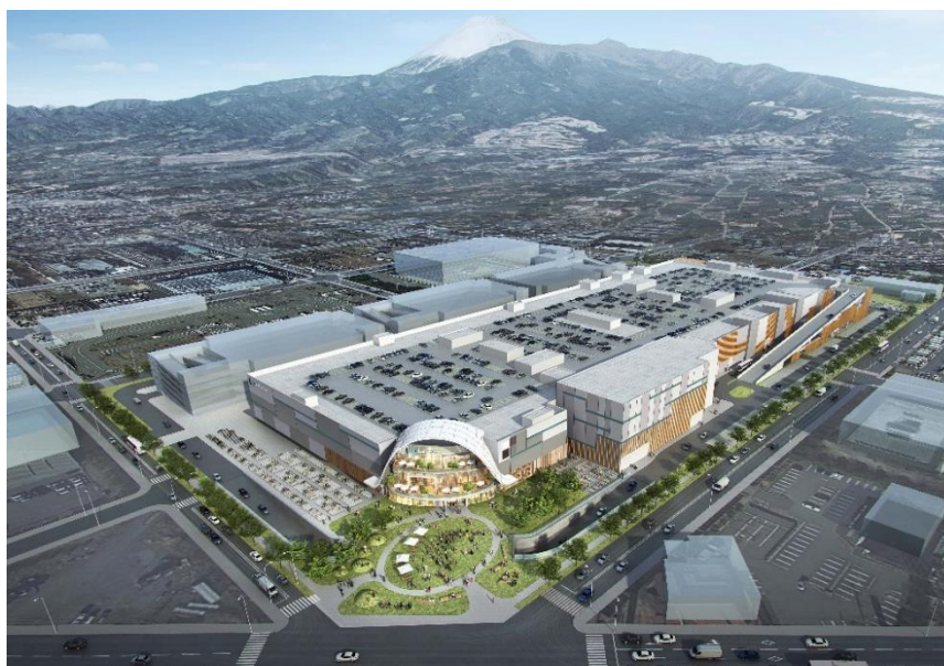
「(仮称) 三井ショッピングパーク ららぽーと沼津」イメージ