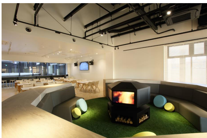
ラウンジ(新設)内観