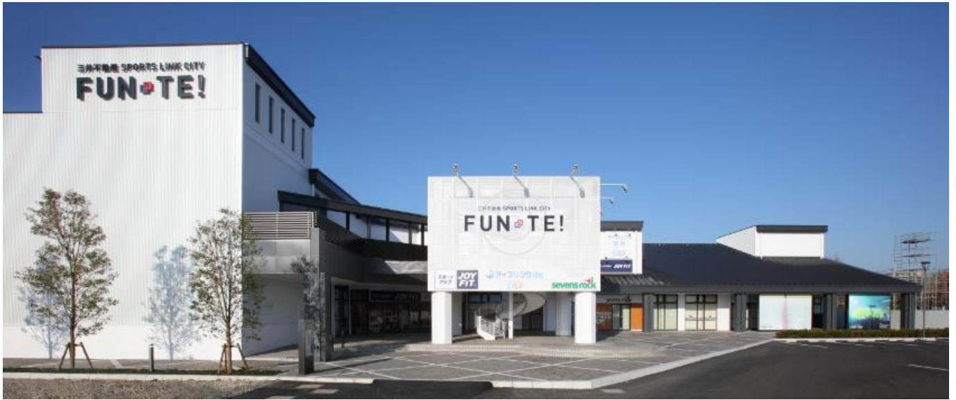
リニューアル後 スポーツ棟外観

より多くの利用者・子供たち・選手の皆さんに、「この施設でもっと練習したい!もっと楽しみたい!もっと上を目指したい!」と思ってもらえるような施設となるよう、アイスアリーナ内・スポーツラウンジ・更衣室・スタジオ・ギャラリー(展示スペース)等を新設・リニューアルしました。