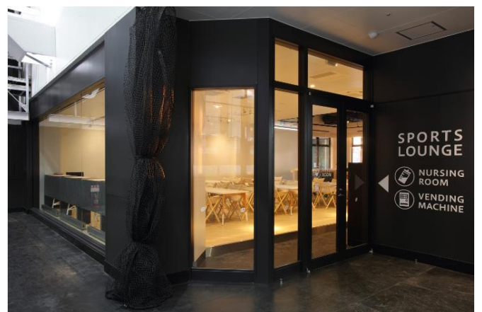
ラウンジ(新設)外観