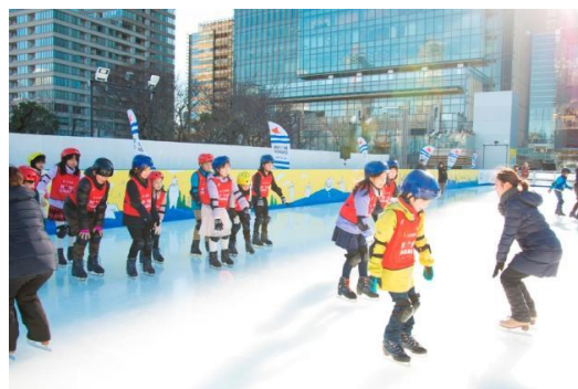
昨年アカデミーの様子

1994年11月7日愛知県名古屋市生まれ。 スケートをしていた姉の影響で3歳からスケートを始める。 2009年JGPファイナルで優勝。2010年に世界ジュニア選手権優勝。2010～2011年シーズンGPシリーズアメリカ杯で優勝し、グランプリファイナルでは銅メダルを獲得。 2013年の全日本選手権で総合2位となり、ソチ2014冬季オリンピック出場。同年の四大陸選手権で初優勝、世界選手権は5回出場し、最高順位は4位入賞。