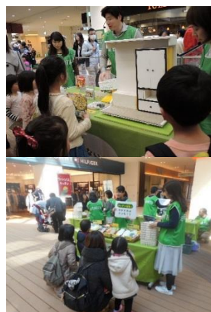
前回実施の様子 上)家具転倒防止 下)災害時に対応できる食材選び

各ブースを廻りスタンプを揃えた方には、災害対策を一覧できる「防災新聞」をプレゼント、また防災関連グッズの抽選に参加できます。