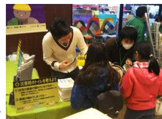
地域防災情報コーナー

防災マップの配布に加えて、自宅に備えておきたい防災グッズの紹介などをクイズ形式で行います。