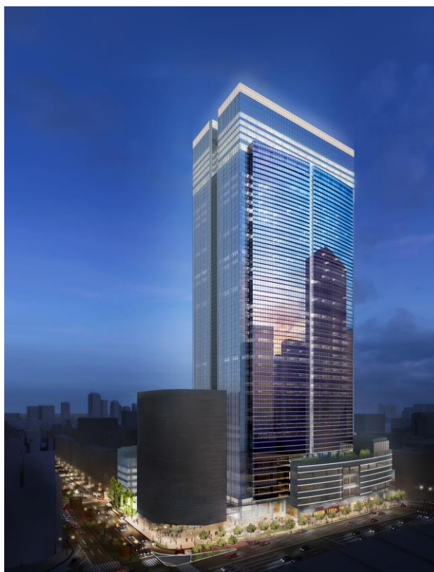
「ブルガリ ホテル 東京」(外観完成予想 CG ※1 )

三井不動産株式会社(本社:東京都中央区 代表取締役社長:菰田正信)とブルガリ ホテルズ & リゾーツは、東京駅前において開発予定の超高層複合ビル内に、日本初となるブルガリ ホテルを開業することに合意しました。この新たなホテルは、「ブルガリ ホテル 東京」として2022年末に開業する予定です。