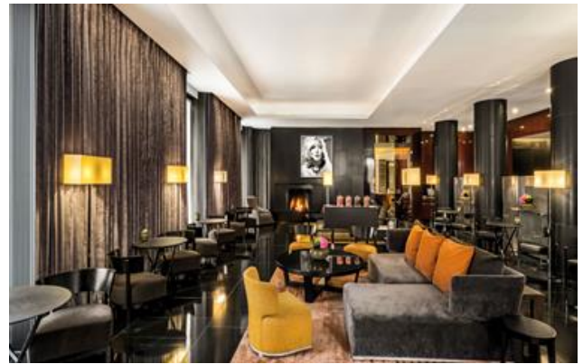
ブルガリ ホテル ロンドン