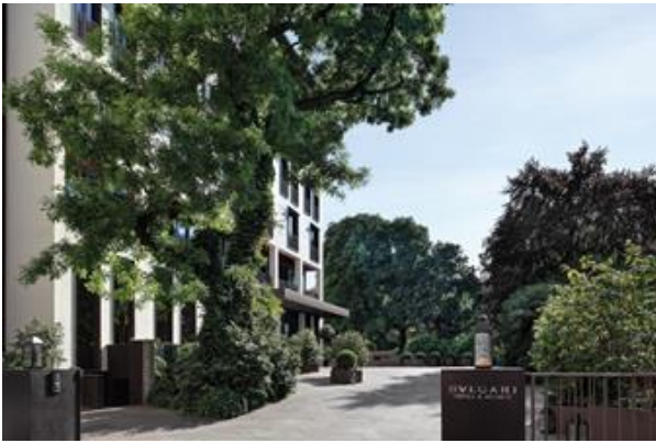
ブルガリ ホテル ミラノ

ブルガリ ホテルズ & リゾーツのコレクションの特徴は、ブルガリらしい特色があり、且つ大胆なイタリアン・スタイルであり、独特な建築デザイン、コンテンポラリーなイタリア料理、豪華なスパに表れています。それらがブルガリブランドの持つエキサイトメント、時代を超えた魅力、そして豪華なイタリアン・ジュエリーの伝統を伝えるのです。ミラノ、ロンドン、バリ、にある3つの象徴的なホテルズ & リゾーツのコレクションから成長してきたブルガリ ホテルズ & リゾーツは、北京、ドバイのプロパティによって更に発展します。2018年から2022年にかけて、上海、モスクワ、パリ、そして東京に4つのブルガリ ホテルが開業を予定しています。