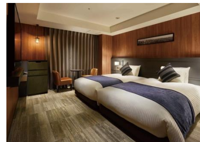
客室(スーペリアツイン)