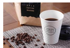
オリジナルブレンドコーヒー