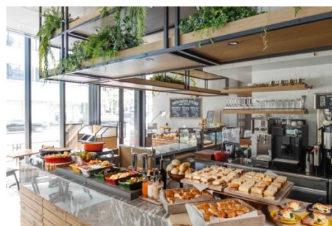
ベーカリーカフェ・レストラン「TOKYO BAKER'S KITCHEN」