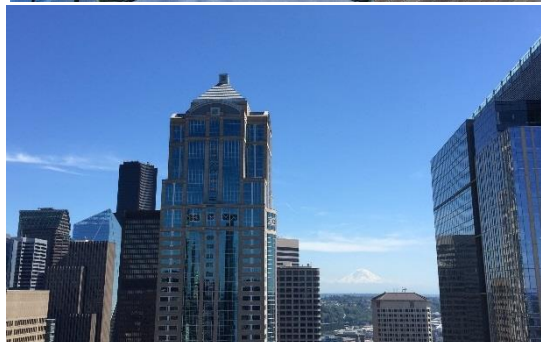
ルーフデッキからの眺望