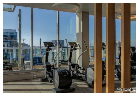
最上階のジムからの眺望