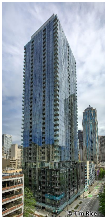
「ウエストエッジタワー」外観

当社グループはグループ長期経営方針「VISION 2025」にて「グローバルカンパニーへの進化」を掲げており、今後も海外事業の飛躍的な成長を目指しています。これまでに米国・英国の欧米諸国に加え、中国・台湾・東南アジアなどで事業を展開しています。米国では、オフィス、住宅など複数の開発事業に取り組んでおり、本年3月に当社グループ初のワシントン DC 圏域での分譲住宅事業「ロビンソンランディング」プロジェクトへ参画し、また、かねてより推進してまいりましたニューヨークマンハッタンのオフィスビル「(仮称)55 ハドソンヤード」開発事業は本年度中に竣工を迎えるなど、複数都市において事業を拡大しており、今後も更なる事業機会の獲得を目指しています。