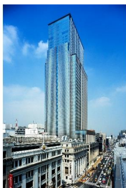
日本橋三井タワー(東京都中央区)