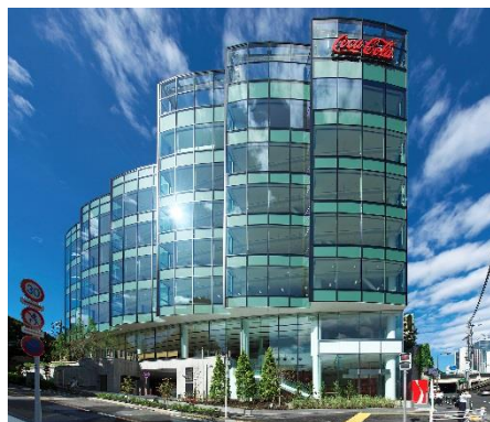
日本コカ・コーラ新本社ビル(東京都渋谷区)