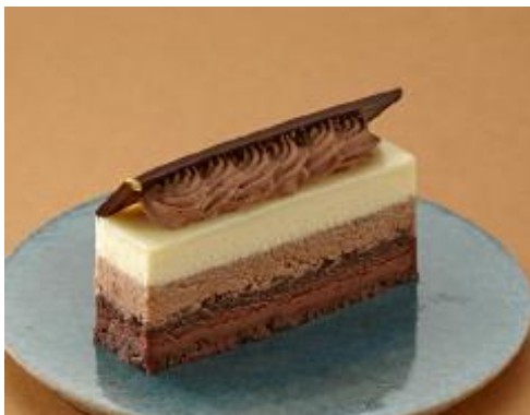
「 アンリ・シャルパンティエ 」3(トワ)ショコラ 1個 648円