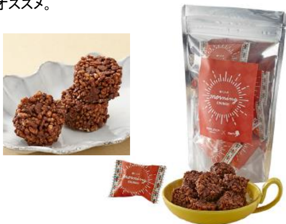
「メリーチョコレート」 × 『三井のオフィス』

栄養バランスにも配慮しきちんと美味しく、満足感が持続するので、仕事スイッチを入れるスイーツとしてオススメ。