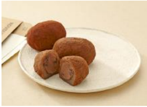
「 笛虎 」やわらか玄米一口餅 1個 各 270円

玄米粉入りの求肥をベースに、チョコと胡桃とココアパウダーのミニ大福。チョコチップ入りのコーヒーパウダーも。