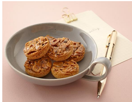
「デメル」ヘーゼルフロレンティーナ 6個入 864円