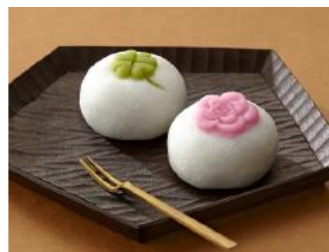
「 塩瀬総本家 」よろこび