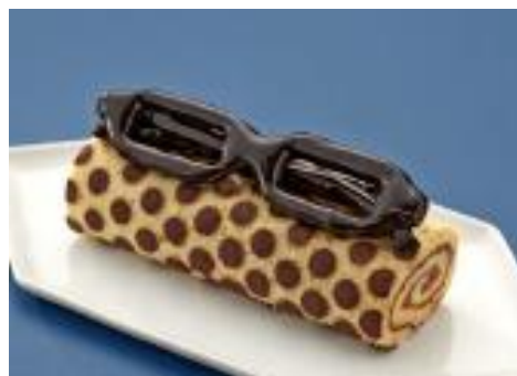
「ロイスピエール」眼鏡ロールケーキ 1個 1,404円

ジューシーなバター風味のフィナンシェと、ほろ苦な抹茶マドレーヌのアソートセット。(各3個)