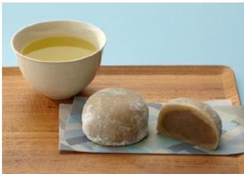
「 からだにえいたろう 」ほうじ茶ラテ餡大福 1個 324円

スローカロリーは持続的なエネルギー源となるので、仕事で集中力を持続したい時や、残業で疲れた時にリラックスするスイーツとしてオススメ。