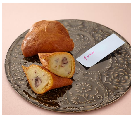
「菊里松月」いもち 1個 195円