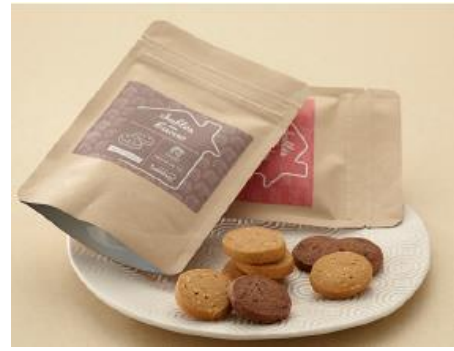
「 サブレヤ 」全粒粉のアーモンドサブレ、

玄米粉入りの求肥をベースに、チョコと胡桃とココアパウダーのミニ大福。チョコチップ入りのコーヒーパウダーも。