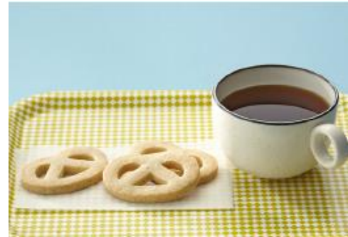
「 グマイナー 」ヴァニレプレッツェルン 6個入 540円

ほうじ茶の香ばしさはそのままに、甘さ控えめながらバランスよい味わいの大福。すっきりとした食後感を実現。