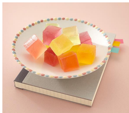
「御朱印」果実風味琥珀糖 ゆめ恋し 12粒入 972円

メロン、レモン、オレンジ、ブルーベリー、いちごなど、フルーツ風味の寒天をお砂糖で包みこんだ創作和菓子。