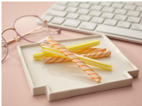
「鶴屋吉信」有平糖(紅葉・銀杏) 5本入 594円

「仕事中だから手を汚したくない」、「仕事中に周りに気づかれずに片手でパクッと食べたい」、「食べるときに音を立てないで食べたい」など… 仕事中ならではの“スイーツあるある”を意識したスイーツ。