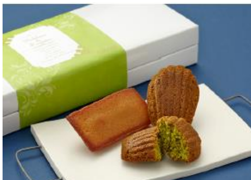
「ロイスピエール」フィナンシェ・抹茶マドレーヌ