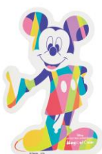
マグネットシート A3(2,970 円)