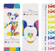
クリアしおり(各 194 円)