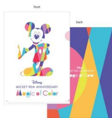
A4 クリアファイル(378 円)