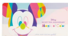
チケットファイル(324 円)