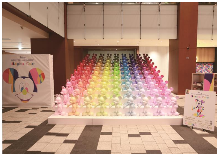
「ディズニー ミッキー90周年 マジック オブ カラー」キービジュアル/会場写真

モノクロ映画からカラー映画へと表現の方法は大幅な進化を遂げ、ミッキーの世界に色は欠かせないものとなりました。本イベントでは「色が作り出す魔法がここに」をコンセプトに、ミッキーと色の持つ多様性を鮮やかに彩られた世界で表現いたします。会場では、ミッキー90周年関連商品を約500種類販売するスペシャルポップアップショップや、会場を鮮やかに彩る90色・90体のミッキーマウス立像、メルセデス生まれのシティ・コンパクト「smart」の特別仕様車等 ※ の展示を展開いたします。また、イベントを実施する施設ごとにテーマカラーを設け、テーマカラーに合わせたノベルティグッズのプレゼントキャンペーンも実施いたします。一部商品は、三井ショッピングパーク公式ファッション通販サイト「Mitsui Shopping Park & mall (アンドモール)」でもご購入頂けます。