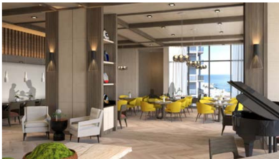
レストラン完成イメージ

本物件には、レストラン（西洋フード・コンパスグループ株式会社に業務委託予定）、プール、大浴場・露天風呂（温泉を予定）をはじめ、多目的ホール、アトリエ、ビリヤード、麻雀ルーム、ピアノ室、ラウンジ、バー、ライブラリーなどの娯楽施設や、ご入居者の憩いの場となるメインガーデンなど、ご入居者のコミュニティを育む共用空間と様々なプログラムやイベントを提供します。