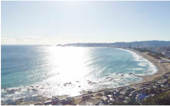
現地からの眺望（本物件 8 階相当の高さより）

本物件は、太平洋を望む標高約 46m の高台に建つ 22 階建のトライスター形状の建物です。約 2/3 の住戸からは、太平洋の大海原や日本の渚百選に選ばれている前原・横渚海岸の海岸線の眺望を愉しむことができ、また約 1/3 の住戸からは山々の美しい緑の眺望を満喫いただけます。さらに、レストラン、大浴場、最上階のラウンジからも、海や山々のダイナミックな眺望をご覧いただくことができます。また建物の足元には約 2,200 m 2 もの広大な中庭を設け、豊富な緑と趣向を凝らした水景がご入居者の憩いの空間を創出します。