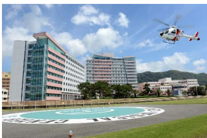
亀田メディカルセンター (※4)