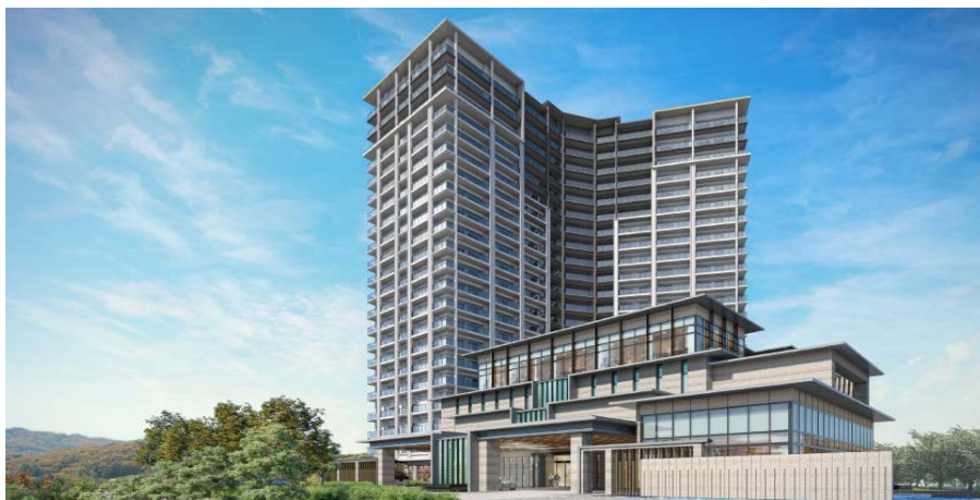
「(仮称)パークウェルステイト鴨川計画」完成予想イメージ

なお、本計画は、2019年6月開業予定の「パークウェルステイト浜田山」に続く、第2号物件となります。