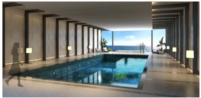
プール完成イメージ