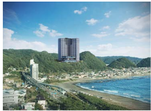
鴨川市内から本計画地方向を望む（建物 CG を合成）