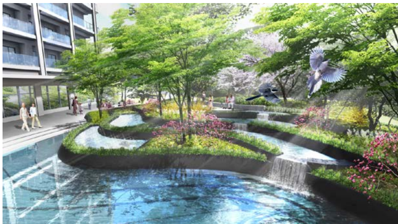
メインガーデン完成イメージ