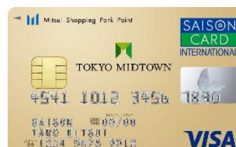
新・東京ミッドタウンカード 《セゾン》