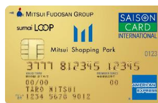
三井ショッピングパークカード 《セゾン》 LOOP ゴールド