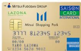
ラゾーナ川崎プラザカード 《セゾン》