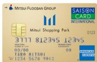
三井ショッピングパークカード 《セゾン》