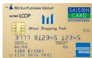
三井ショッピングパークカード 《セゾン》 LOOP