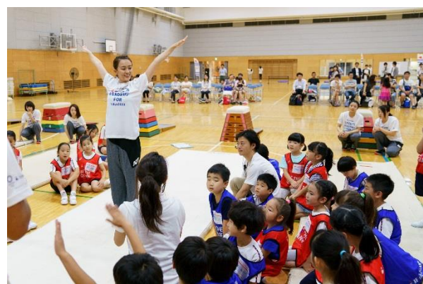
第9回/体操アカデミー