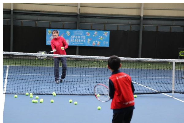
第15回/テニスアカデミー