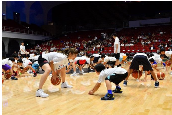
第10回/バスケットボールアカデミー