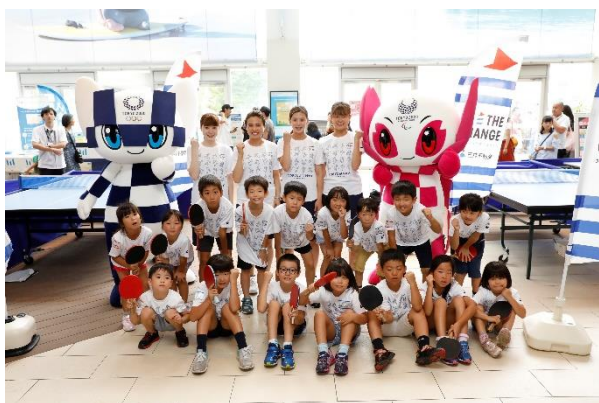
第14回/卓球アカデミー