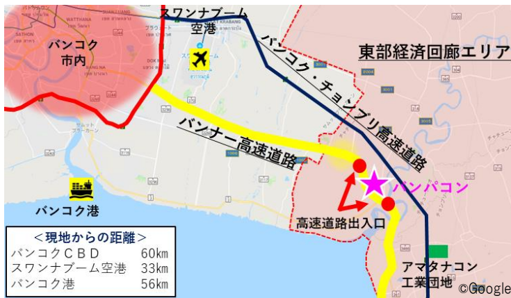
パンパコン位置図