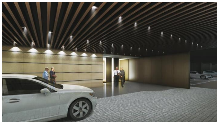
VIP 専用車寄せ イメージ

また「フォーシーズンズホテル東京大手町」との連携サービスも実施します。39 階のロビー階のエグゼクティブラウンジでは、商談や会食といった用途で貸切利用ができ、ゲストに対する最上のおもてなしをサポートします。その他、スイートルーム・レストラン個室・プライベートバーラウンジの利用や、スパ・フィットネスの利用、オフィス専有部へのケータリングサービス、ランドリーサービスといったホテルならではのサービスも利用可能です（一部検討中の内容を含む）。