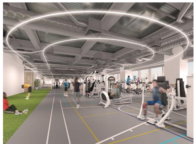
ワーカー専用フィットネス イメージ