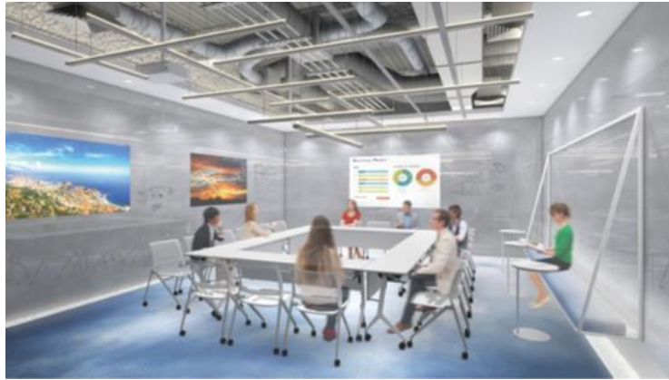
ワーカー専用カンファレンス イメージ