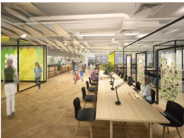
ワーカー専用食堂 イメージ

「Otemachi One」では様々なワークスタイル・ライフスタイルを総合的にサポートします。