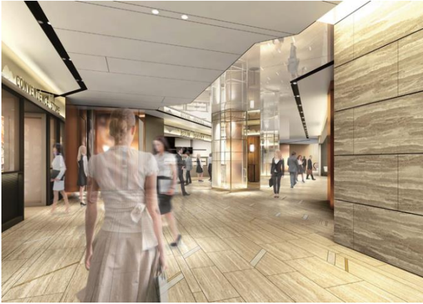
「Otemachi One Avenue」イメージ