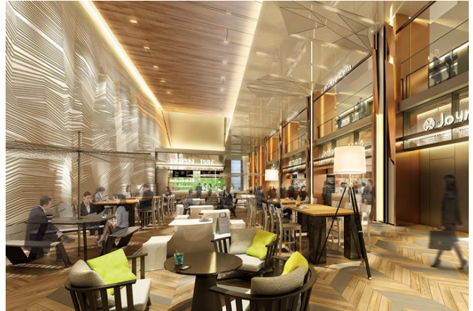
2 層吹き抜けエリア イメージ