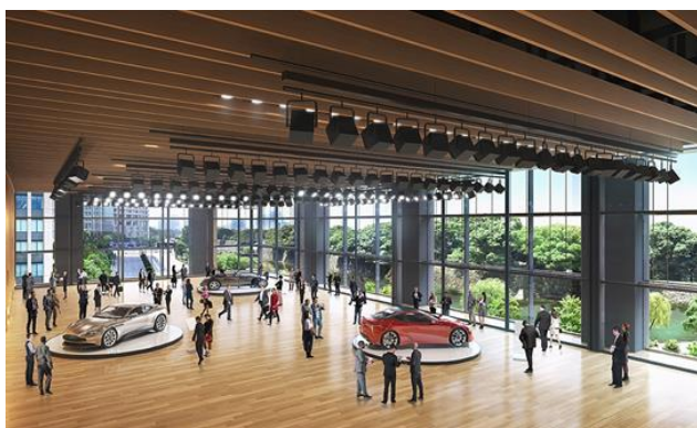
「大手町三井ホール」(平土間形式) イメージ

高さ約 7mのガラス壁を採用し皇居の緑を存分に享受できる多目的ホール「大手町三井ホール」は約 700 m 2 のホールと約 380 m 2 のホワイエから構成され、国際会議や企業の商品発表会といったビジネスのイベントから、音楽ライブなどエンターテインメントのイベントまで、様々な用途での活用が可能であり、ビジネス交流・国際交流の促進および文化・芸術の発信の新たな拠点となります。公式 HP: https://www.otemachi-hall.jp/