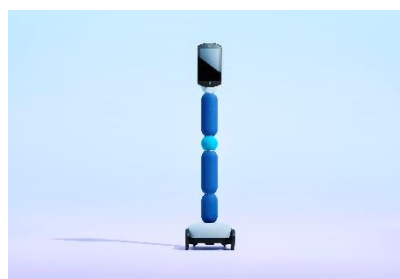
普及型コミュニケーションアバター 「newme(ニューミー)」

両社は協働してアバターの都市実装を推進し、2020年内を目処に、日本橋エリアにおいてアバター100体の投入を目指します。