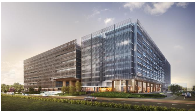
本物件イメージパース

本事業は、地上 12 階建て、4 棟構成、貸付面積約 330,000 m 2 (約 10 万坪)の大規模オフィスビル開発です。計画地は、バンガロール市南東部の IT パーク集積エリアにおける、RMZ 社フラッグシップ IT パーク「RMZ エコワールド」内に所在します。RMZ エコワールドは既に 2 街区、約 20 万坪が稼働しており、グローバル IT 企業、金融機関、コンサルティングファーム等が入居、合計約 60,000 人が就業しています。ハード面では、多彩な飲食店、フードコート、クリニック、ウェルネスセンター(ジム、スイミングプール、テニスコート等)、野外ステージなど、様々な便利施設を揃えている他、ソフト面では、就業者間の交流イベントを積極的に実施したり、独自開発の就業者専用アプリケーションにより利便性を高める等、イノベーティブな取り組みを行って良質な就業環境を提供しています。