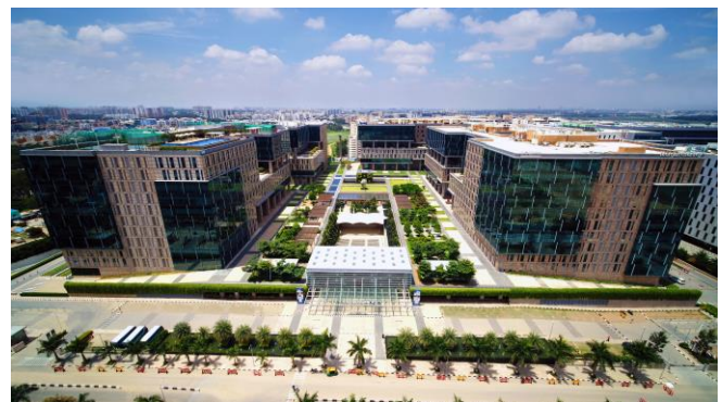
エコワールド内開発済街区