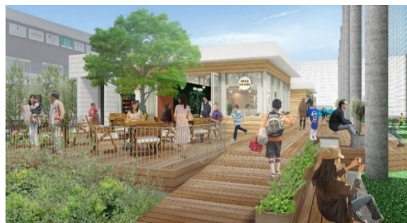
「MIFA Football Park 立川(仮称)」イメージ

なお、新型コロナウイルス感染症拡大の状況、政府・自治体からの要請等により、本リリースの内容は変更になる可能性がございます。変更があった場合は、「MIFA Football Park 立川(仮称)」ホームページにてお知らせいたします。何卒ご理解のほどよろしくお願い申し上げます。