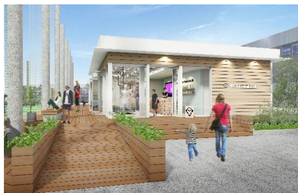
エントランスイメージ