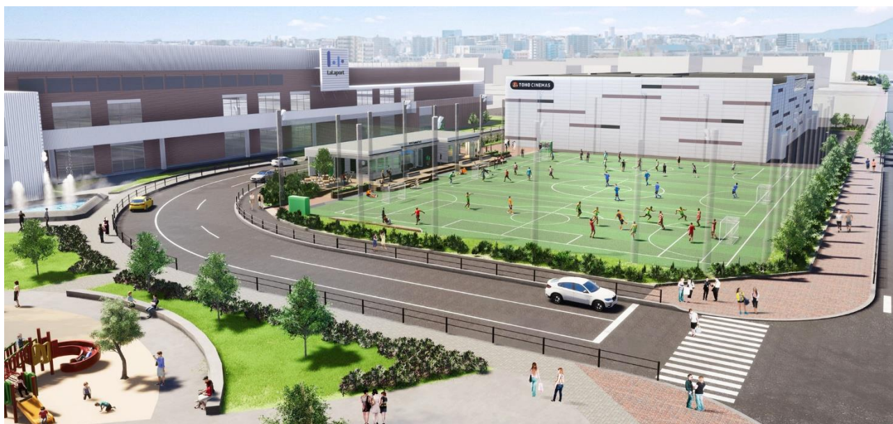
多摩モノレール「立飛」駅からのイメージ