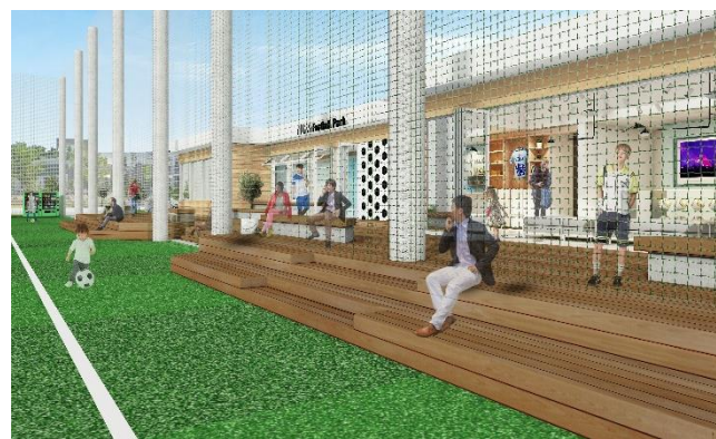
観覧スペースイメージ