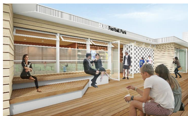
観覧スペースイメージ