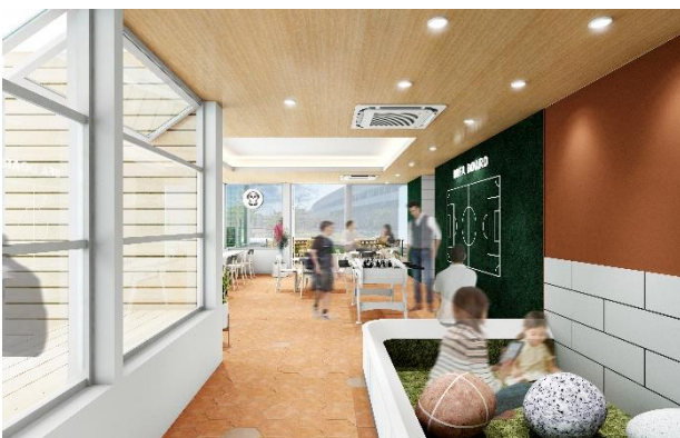
キッズスペース 内装イメージ