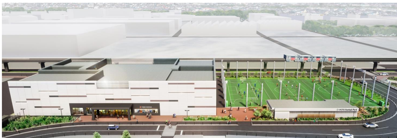
「三井ショッピングパーク ららぽーと立川立飛」からのイメージ