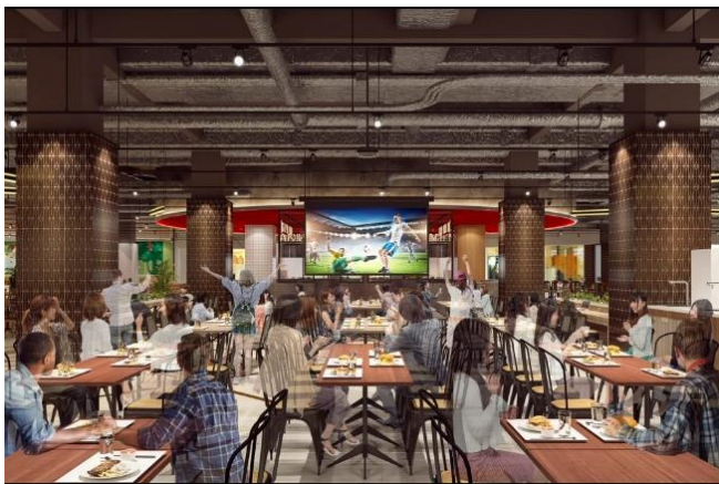
▲パブリックビューイングスペース

貸切パーティや様々なイベントに対応可能な約50㎡のコミュニティスペース『ららスタジオ』を導入。ソファを含む24席をご用意しており、お子さまのお誕生日会やランチ会等でもお使いいただけます。