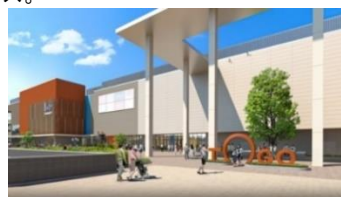
▲シンボルツリー『育（はぐくみ）の木』 フォトスポット『ビッグ TOGO』

大きく育つことが特徴の一つでもあるクスノキをシンボルツリーとして設置。『ビッグ TOGO』のモニュメントと合わせて記念撮影をお楽しみいただけるスペース。