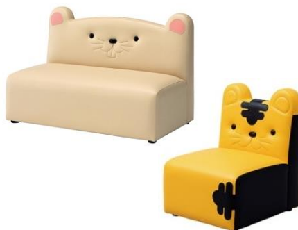
▲兄弟姉妹待機用イス

地元・中日新聞社のアクティブなママの集まり「ママブレーン」の意見を取り入れ、一部授乳室への兄弟姉妹待機スペース導入や、フードコート内に親子が対面で座れるベビーホールを設置。