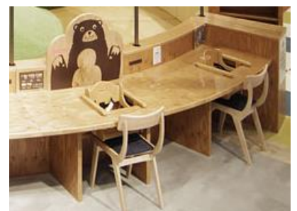
▲参考写真：らぼーと名古屋みなとアクルス ベビーホール