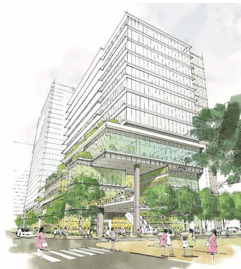
【1階中野駅前広場側商業イメージ】

駅から連なるペDESTリアンデッキを敷地内に延長し、デッキレベルの歩行者ネットワークを創出します。