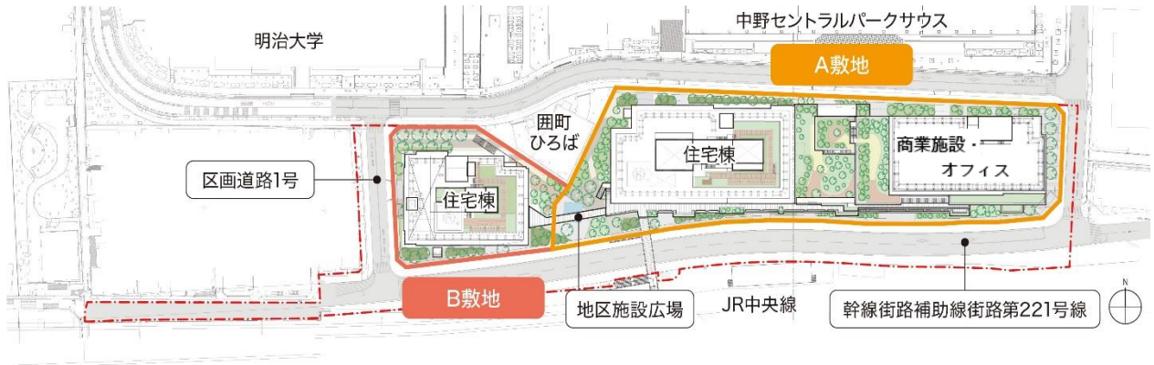
【施工区域図・建物配置図】