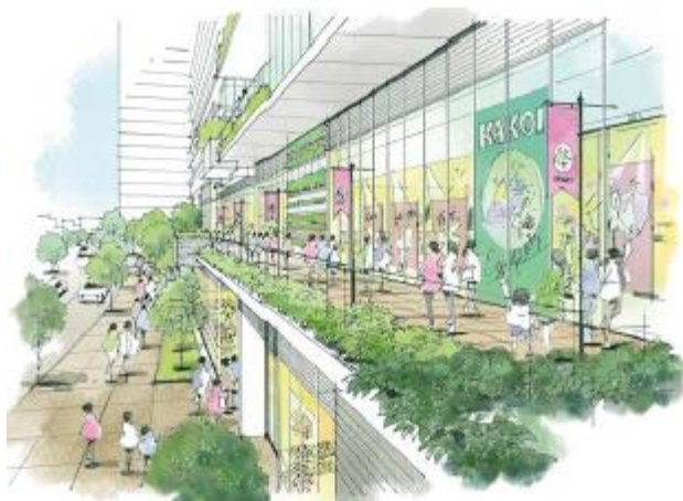
【2階デッキ商業イメージ】

約 1,000 m 2 の地区施設広場は、既存の区立「囲町ひろば」と空間的に連続して配置し、緑地による潤いと新たな賑わいを創出します。