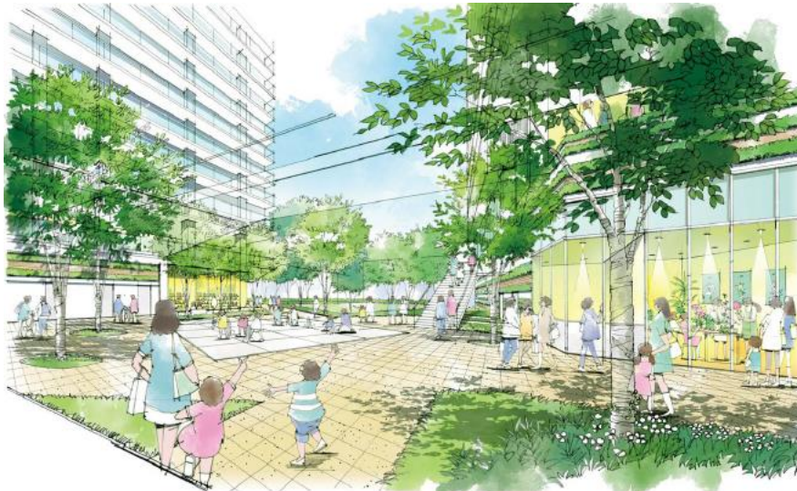
【1階地区施設広場のイメージ】

約 1,000 m 2 の地区施設広場は、既存の区立「囲町ひろば」と空間的に連続して配置し、緑地による潤いと新たな賑わいを創出します。