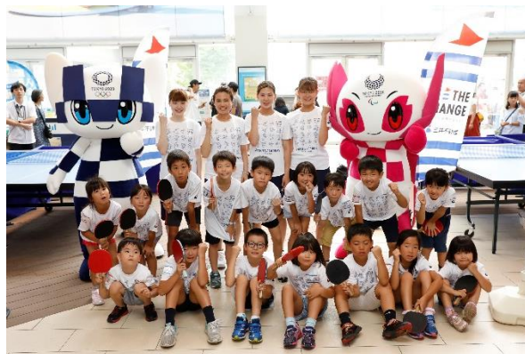
第14回/卓球アカデミー