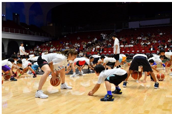
第10回/バスケットボールアカデミー