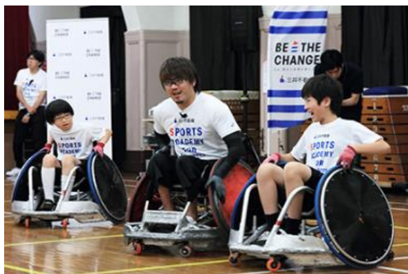
第8回/ウィルチェアラグビーアカデミー