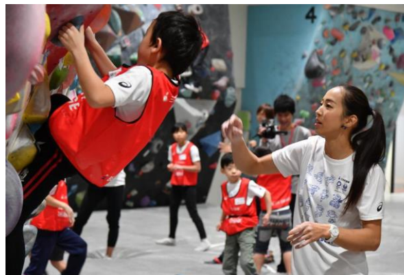
第17回/スポーツクライミングアカデミー