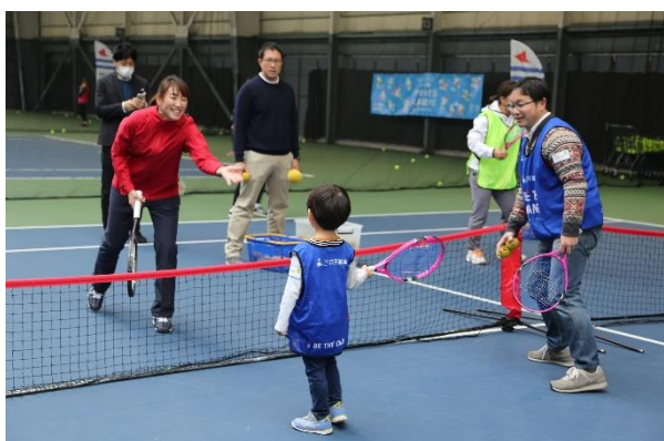
第15回/テニスアカデミー