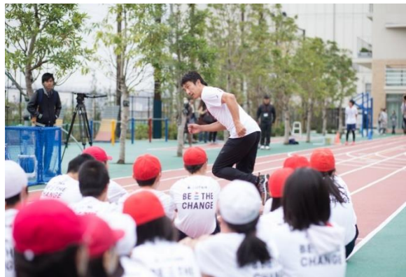
第5回/陸上アカデミー