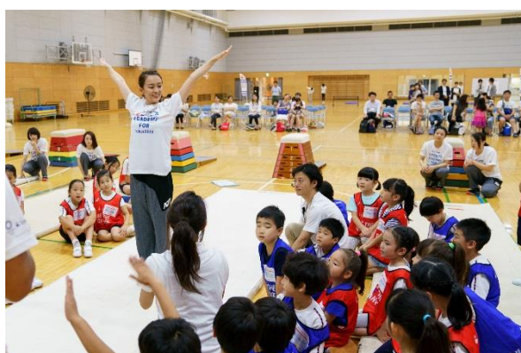
第9回/体操アカデミー