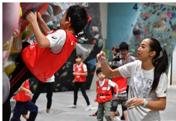
第17回/スポーツクライミングアカデミー