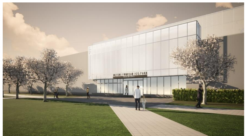
施設イメージパース