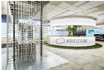
ワークスタイリング SHARE (ワークスタイリング六本木一丁目)

2020 年度末には「ワークスタイリング SHARE」「ワークスタイリング FLEX」が 74 拠点となり、「ワークスタイリング SOLO」13 拠点、「三井ガーデンホテルズ」等提携 21 拠点和併せて、全国 100 拠点を超えるネットワークとなる予定です。