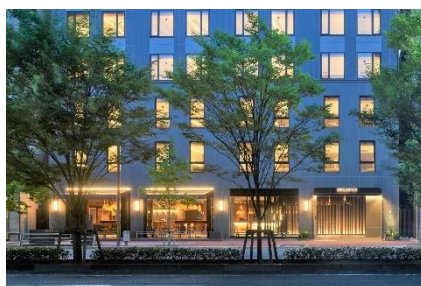
sequence KYOTO GOJO