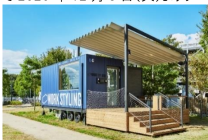
ワークスタイリング SOLO モビリティタイプ (ららぽーと柏の葉店 外観)

会員の様々なニーズに柔軟に対応するため、「ワークスタイリング SOLO」はオフィスビルでの展開に加え、モビリティタイプを展開します。「アーバンドッグららぽーと豊洲」「ららぽーと柏の葉」「三井アウトレットパーク多摩南大沢」にて 2020 年 12 月 8 日(火)よりサービス提供を開始します。