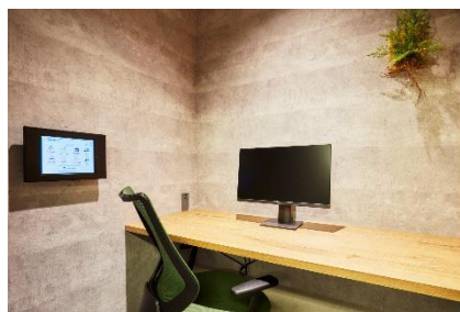
ワークスタイリング SOLO 個室内