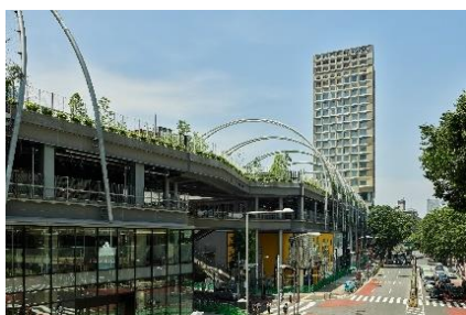
sequence MIYASHITA PARK

12月4日(金)よりワークスタイリング SHARE 提携拠点に「sequence MIYASHITA PARK」「sequence KYOTO GOJO」「sequence SUIDOBASHI」3つのホテルが加わります。これにより、「三井ガーデンホテルズ」等ワークスタイリング SHARE 提携拠点数は21となります。