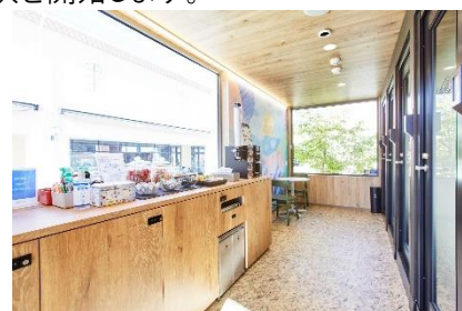
ワークスタイリング SOLO モビリティタイプ (ららぽーと柏の葉店 内観)