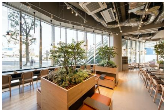
KOITTO TERRACE 内観 (2021年1月29日撮影)

JR小岩駅の開業から百余年の歴史を刻んできた小岩地区では、現在複数の大規模再開発事業が進行しています。まち全体が新しくなる中で、「まちとヒト」、「ヒトとヒト」をつなぎながら、地域をさらに盛り上げていくため、KOITTOが中心となり、官民地域連携のもと、公共的空間の管理・活用も視野に入れた、魅力あるエリア作りをオール小岩で進めていきます。初動期はコロナ禍の影響を受ける地域を応援するため、オンラインイベント、テイクアウトマップづくりや販売場所の提供、テレワーク支援など、ニューノーマルな暮らしに寄り添ったエリアマネジメントを展開します。