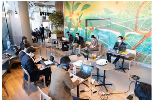
オンラインイベント中の様子。 オンライン会議にも対応できるよう無線 wifi も完備。