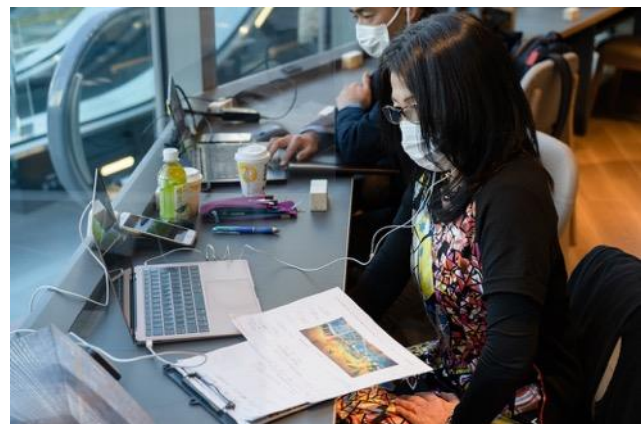
店内アートを担当された方にもゲストとして参加。 アートに込めた想いも参加者に紹介されました。