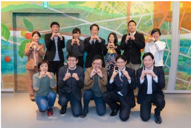
トークゲスト・運営メンバー 集合写真 (撮影のためマスクを外しています)

1月30日に KOITTO TERRACE のオープンを記念して、住民有志によるオンラインイベントが開催されました。まちで働く 100 人を起点に人と人をつなげる「江戸川区 100 人カイギ」のゲストトークの配信会場として KOITTO TERRACE が利用され、総勢 42 名(オンライン)の方が参加しました。ゲストのまちに対する熱い想いに触れながら、参加者同士の交流が深まり、今後のまち運営に対する期待が膨らむイベントとなりました。