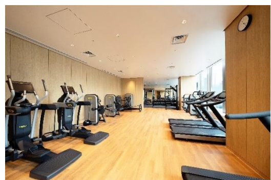
mot. Fitness(日本橋室町三井タワー)