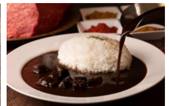
ホテルザセレスティン東京芝 オリジナルカレー