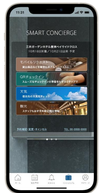
スマートコンシェルジュ