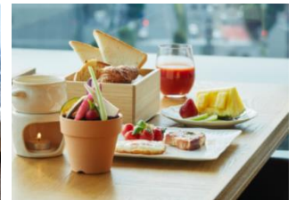
朝食券 利用イメージ