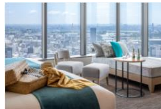
宿泊招待券 利用イメージ