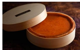
鳥羽国際ホテル オリジナルチーズケーキ