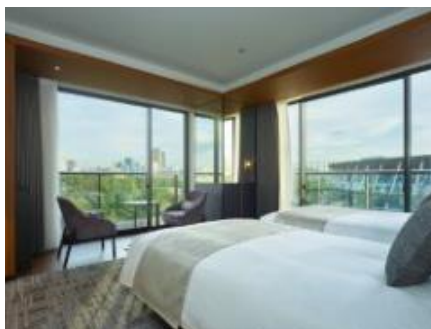
三井ガーデンホテル 神宮外苑の杜プレミア