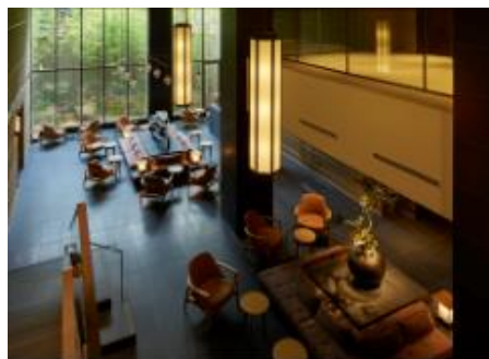
ホテル ザ セレスティン京都祇園