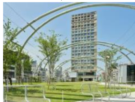
sequence MIYASHITA PARK